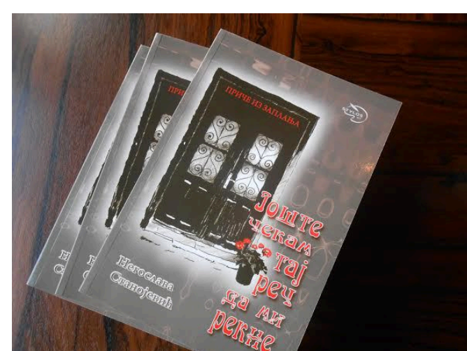
Приче на zaplanjskom dijalektu