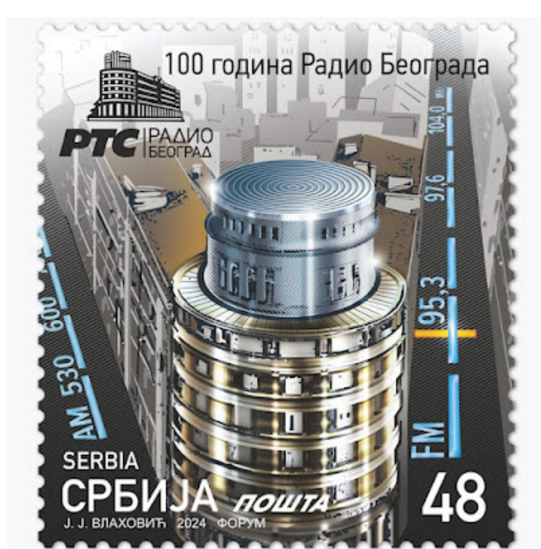
Јубиларна поштанска марка Радио Београда