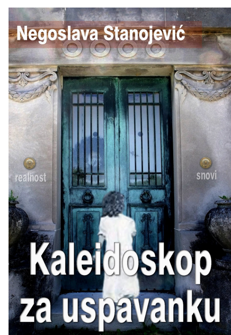
Kaleidoskop za uspavanku